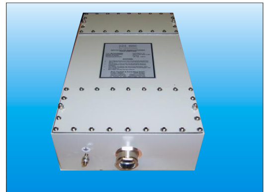
Einfügungs-Dämpfung nach CISPR 17 in 50 Ω-Systemen, asymmetrisch, mit und ohne Last

Für TEMPEST- und EMP-Anwendungen, sowie bei möglichen Überspannungs-Spitzen, werden die Filter mit Varistoren (V-Serie) ausgestattet.